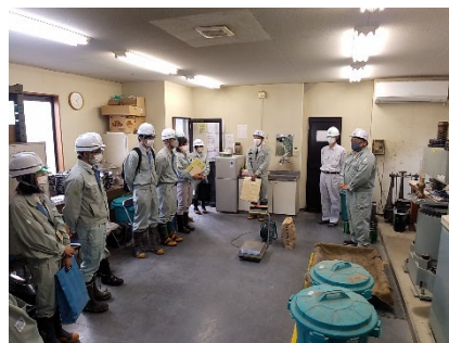
高田産業（生コン工場）